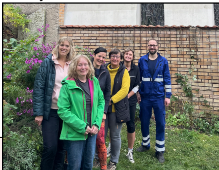
Dobrovolnický tým z Veolie.