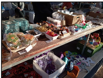
Na trhu jsme nabízeli různé druhy dekorací a výrobků od našich obyvatel.

Od října jsme se s obyvateli vrhli na výrobu podzimních věnců, podzimních dekorací a pečení perníčků. Věci jsme nabízeli na trzích na náměstí Jiřího z Poděbrad, kde jsme poprvé otevřeli vlastní stánek. Obyvatelé si tak v rámci pracovní terapie vyzkoušeli práci prodavače a povinnosti s tím spojené.